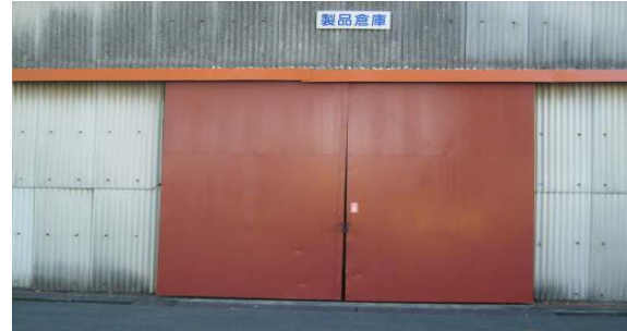
* 大型扉(ハニカムならではの軽量大型扉)