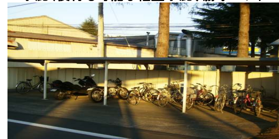
* 駐輪場(駐輪場屋根も薄型ハニカムでスッキリしたデザイン)