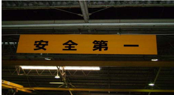
* 看板(場内表示ボードもハニカム製)