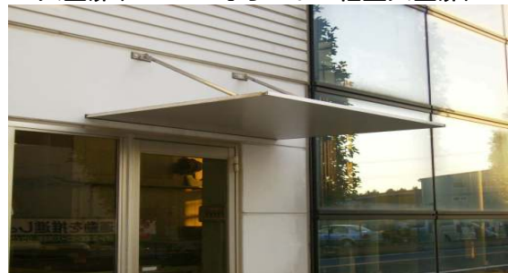
* 小庇(後付も可能な軽量小庇、勝手口に)