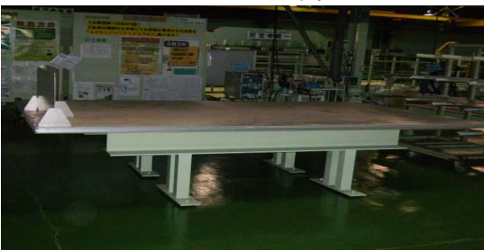
* 作業台(ハニカムの特徴を生かした大型・軽量作業台、可動式も可能)