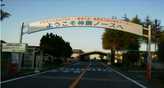
* サイン(10mを超える大型サインも製作可能、工場正門のウエルカムボードに採用)