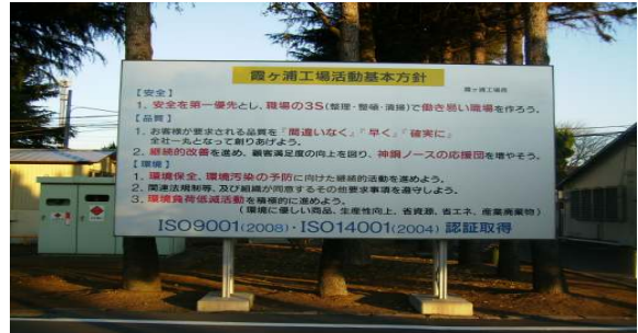
* 掲示ボード(平滑性に優れ大型掲示ボードも製作可能)