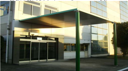
* 大型庇(4M×6Mの大型庇、事務所エントランス車寄せに)