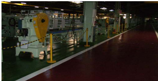
* 安全ポール(アルミ製安全ポールでスッキリしたデザイン)