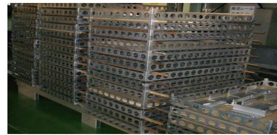
* 軽量パレット(作業効率アップ、仕掛品の整理に活用)